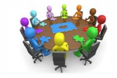
Робота в групах