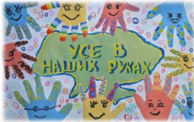
Змістова лінія «Добробут»