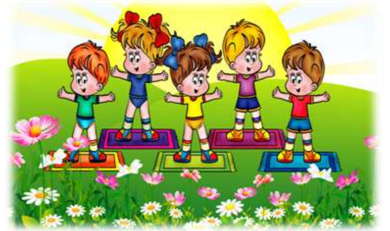
Змістова лінія «Здоров'я»