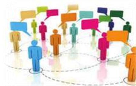
Аналіз історій і ситуацій