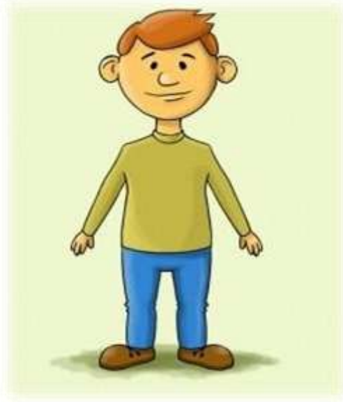
Змістова лінія «Людина»