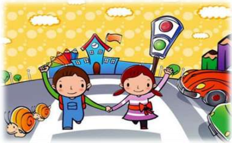
Змістова лінія «Безпека»