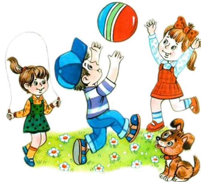
Змістова лінія «Людина серед людей»